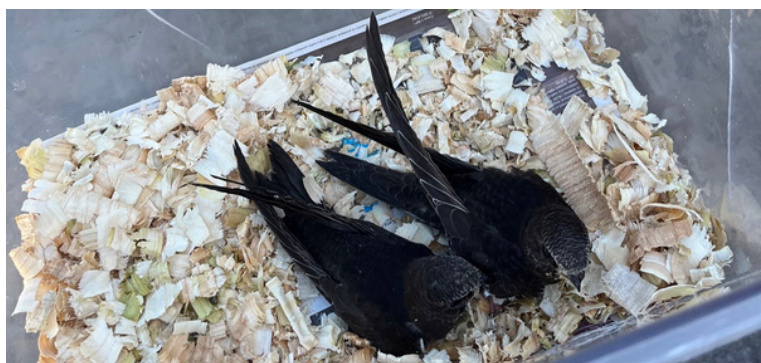
Mláďata našla v půlce července domov v budkách v Jihlavě.