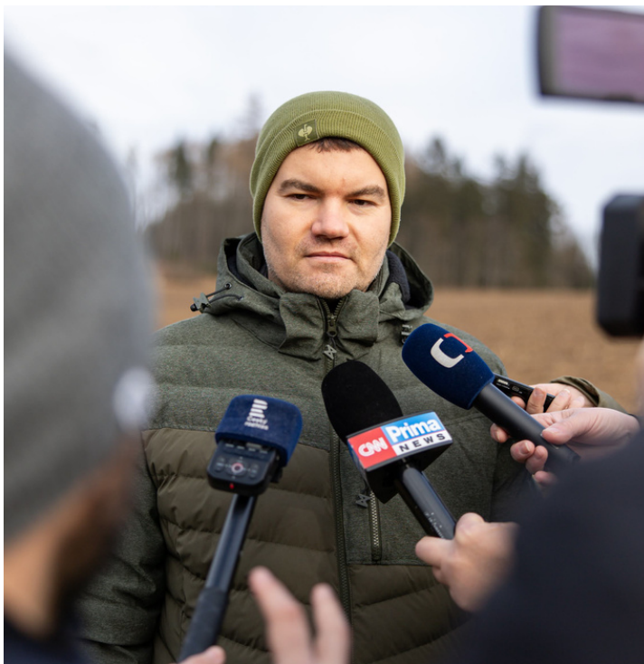
4x. foto J. Loskot, Stanice Pavlov. Média měla o vypuštění orla velký zájem.