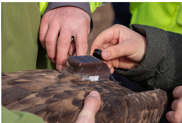
Vysílačka, která monitoruje orlův pohyb.